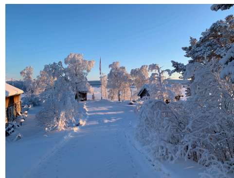
Tilbake på tunet Noatun en kald januardag etter at sola igjen kommer over horisonten.