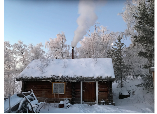
Badstua på tunet på Noatun.