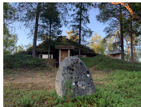
Elsensteinen foran Peisestua. Vindmøllstårnet til høyre.